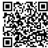
https://www.youtube.com/watch?v=N5XDNPt9U YouTube 約1分半