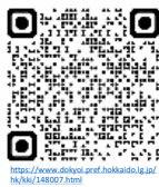
作年度までの 取組はこちらから