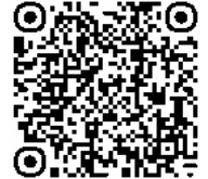
https://www.police.pref.hokkaido.lg.jp/tdt_menu/05_kouhou_2.html 詳しくはこちらから