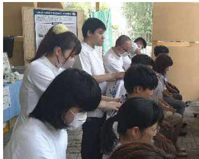
マッサージの様子（札幌視覚支援学校）