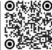
https://www.youtube.com/watch?v=h4yqzRm9U YouTube 約1分