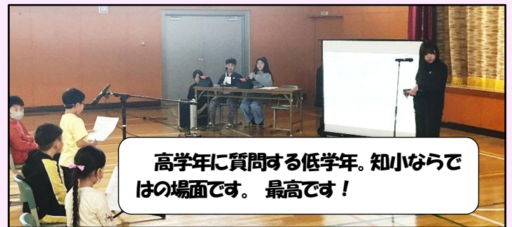
高学年に質問する低学年。知小ならではの場面です。最高です!

前期の児童会活動をみんなで確認する児童総会がありました。児童会の活動こそ、まさに自分たちで学校生活を創る活動です!高学年を中心にいろいろな活動のアイデアを出し合って、ぜひ楽しい学校を創りあげてほしいです。子どもたちの主体的な活動を教職員は全力でバックアップします!