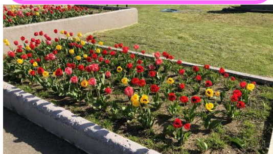
花壇はチューリップが満開! 稲垣さんに感謝! 中高学年, 力を合わせて畑作業! (低学年は写真はありますが, 7人みんながんばりました)