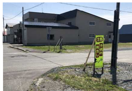
写真は高橋宅前交差点