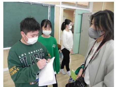
～1年生お世話活動より～

学期はじめにきちんと復習を行い、児童が学習してきたことを発揮できる状態で実施していきます。